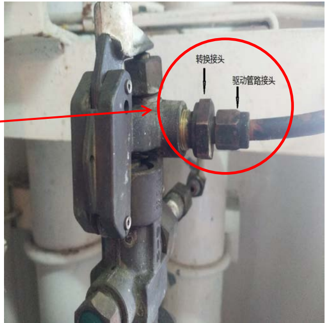
图 3 增压阀（采自气瓶间）